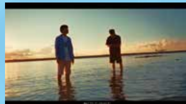
▲カラーグレーディング後の素材