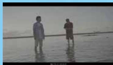
▲撮影時そのままの素材

これは実に骨の折れる作業なんですけど、撮影した素材を生かすも殺すのもこのカラーグレーディングという作業がとても重要になってきます。今回は久米島の方にだけ、こっそりそのピフォアフターのほんの一部をお見せしちゃいます！