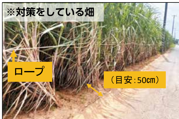
※対策をしている畑