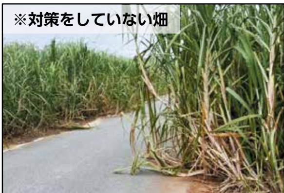
※対策をしていない畑

※さとうきびが倒れ交通に支障をきたしている道路は複数ヵ所確認されています。 ※県外ではこどもが自転車で走行中、沿道に張り出した生垣の枝を避けようとして、車道上に転倒。後続の車に轢かれて死亡する事故が発生。