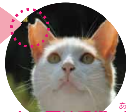
あかし カットの耳は手術の証

✓カットが入った猫を「さくらねこ」と呼びます。 久米島には横一文字カットの猫もいます。