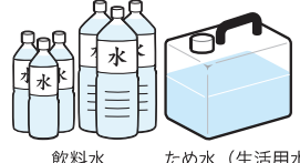
飲料水 ため水(生活用水)

懐中電灯、ラジオ(電池)、携帯電話・電池式充電器、飲料水・生活用水、カセットコンロなどのご準備をお忘れなく