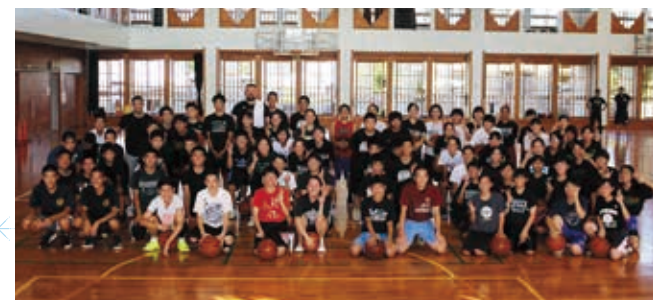
写真：中高校生の部（旧久米島中学校）