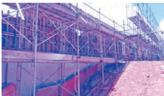
△風の帰る森本館工事の様子

お問合せ プロジェクト推進課 ☎098-985-7141 一般社団法人 久米島風の帰る森 kazemoristaff@gmail.com