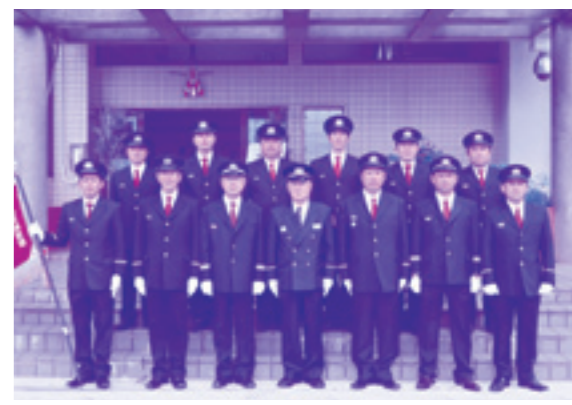
久米島町消防本部 消防団

本年も消防行政へのご理解とご協力の程宜しくお願いいたしますとともに町民の皆様のご健康とご発展を祈念申し上げます。