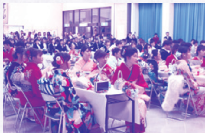
華やかに着飾った新成人