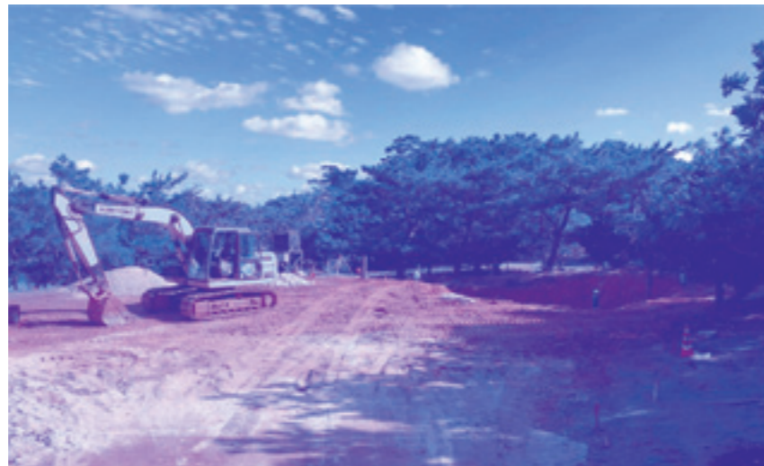
「風の帰る森 施設本館 新築工事」杭工事完了

工事の期間中、銭田森林公園は遊び場として利用することはできませんが、工事車両が出入りすることと工事範囲(ロープで囲っています)への立入禁止など一部利用制限がございます。ご迷惑をおかけしますが、ご協力よろしくお願いたします。