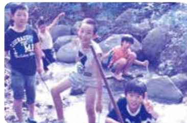
ホテル館の体験授業