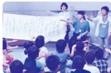
くめしゅわ交流会