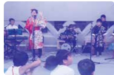
なんくるさんしんライブ