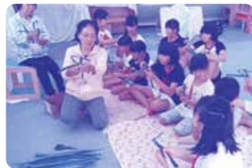
西銘老人会との交流会

2012年7月に保養を開始し、今年11月現在で通算66回、2,883人の保養を実施してまいりました。これもひとえに久米島の皆さまのたくさんの応援のおかげです。本当にありがとうございます。今後とも、よろしくご理解・ご協力のほどお願い申し上げます。