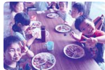
なでしこ保育園との交流会