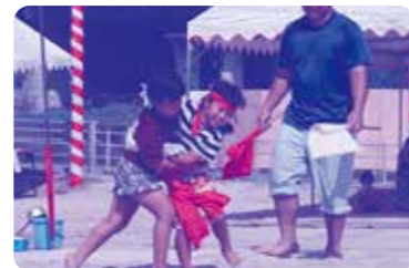
村内イベントへの参加