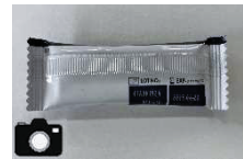
添付イメージ （製造番号、使用期限）