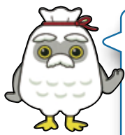
チエブクロー (全国シルバー人材センター 事業協会キャラクター)