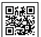
(公社) 沖縄県シルバー人材センター連合ホームページ