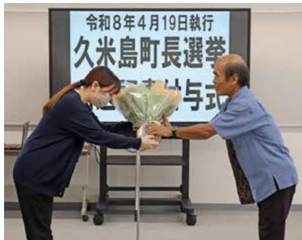
▲ 職員から花束を受け取る桃原町長