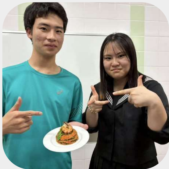
ゼミ活動(料理ゼミ)