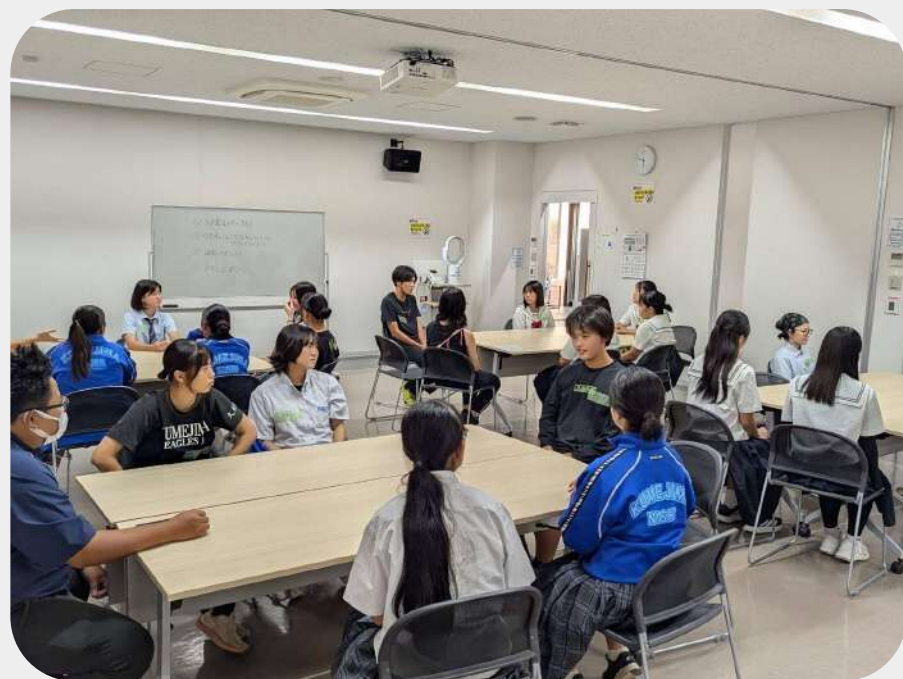
中高交流推進活動