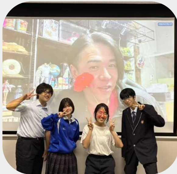
キャリアイベント (ハタラクミライトーク)