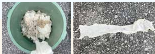
※布類が流されていたケース (貝殻類が流されたケースもあります)

最近、下水道のマンホールポンプの詰まりが多発していますので、トイレや台所、浴室などの汚水以外は流さないようにご協力をお願いします。