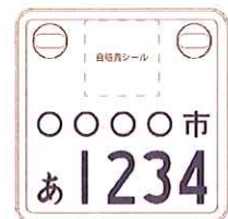
通常の原付よりも小型化！