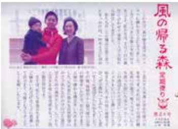
△久米島キッズケアラボ（上）/協力隊着任のご挨拶（下）

お問合せ 一般社団法人焔風舎 mail@kazenokaerumori.com ☎098-996-3301（宿泊問合せ） プロジェクト推進課 ☎098-985-7141