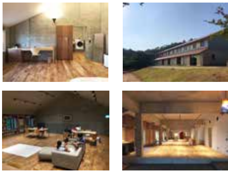
△建物内観 / 外観

さて町民向けの一般開放についてですが、まずは施設の目玉である「風森文庫」を目的に来館されるケースが多く想定されます。その際、消毒やマスク着用等の感染症対策を厳守いただき、