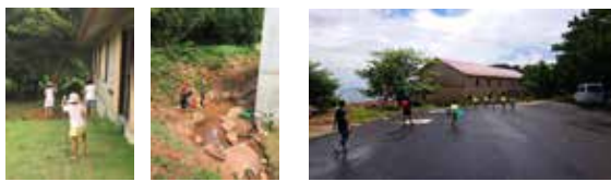
△建物内観 / 外観

場合によっては入館規制を行うこともありますので、事前にご理解ください。ほか施設では、飲食やオリジナルグッズの販売も行っています。最後に宿泊についてですが、こちらは町民向けのプラン（期間限定）も用意しています。詳細については、Facebook、Webサイト等でご確認ください。宜しくお願いたします。（7月10日現在）