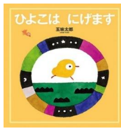
「ひよこは にげます」 作：五味太郎