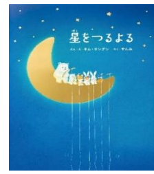
「星をつるよる」 作：キム サングン