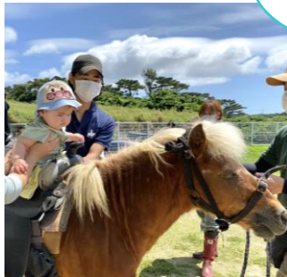
初めて1人でお馬さんに座った日♡”