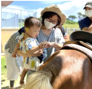
ママと一緒に触ってみよう♪