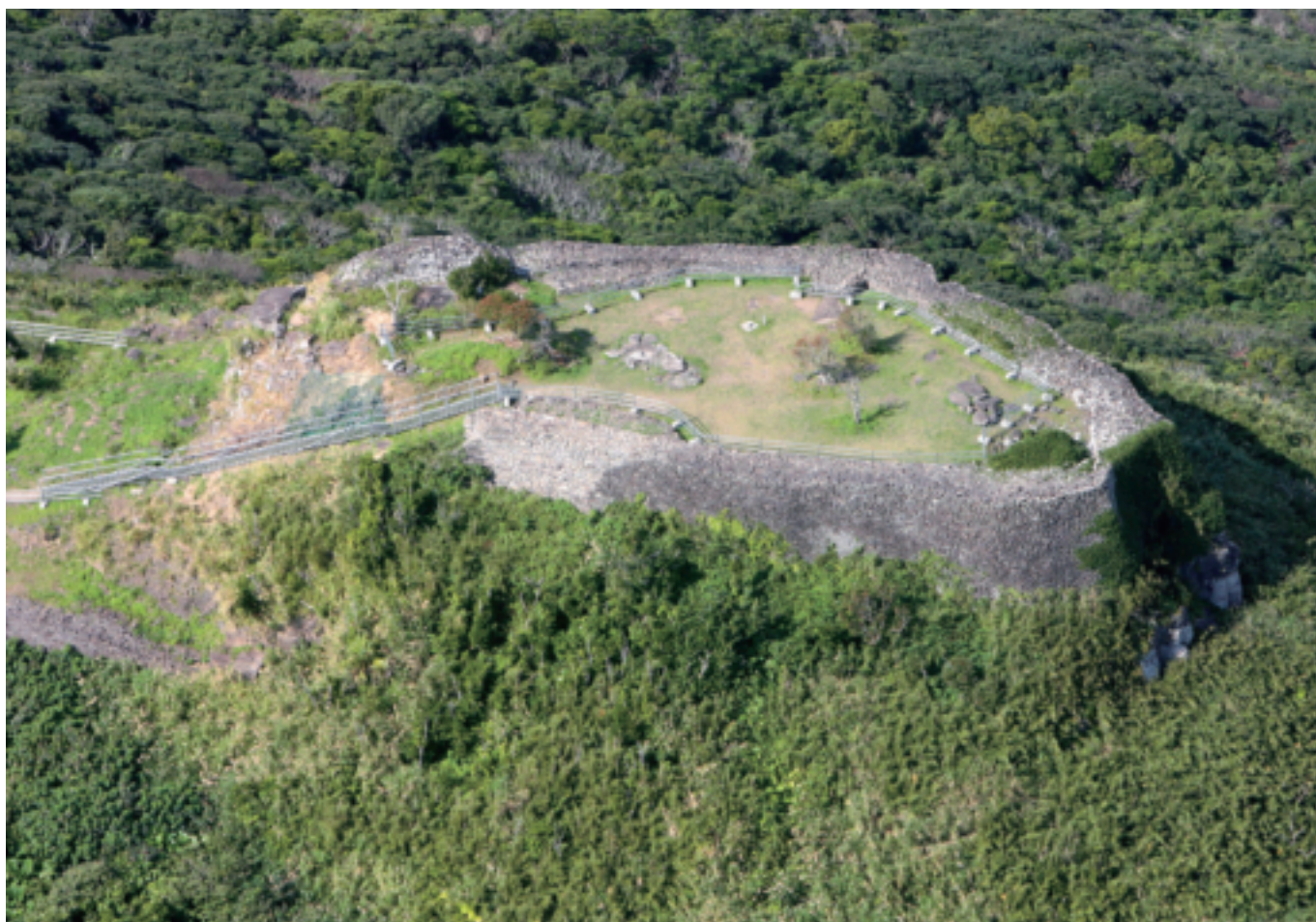
宇江城城跡（平成21年7月23日 国史跡に指定）