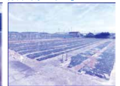
※「畦畔」、「水路」が無く「畑地化」している。