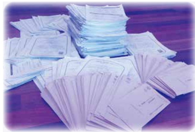
※アンケートの集計結果は後日、町のホームページに掲載させていただきます。

さあ、これからいよいよ皆さまからのお声をもとに、島が向かっていく方向とその先にある未来のカタチを確認し、そこに向けての地図を描いていく段階に入ります。引き続き皆さまからのご意見、アイデアもお待ちしています。