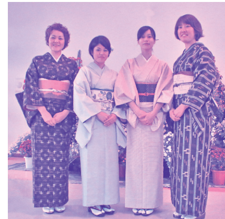
久米島紬着付け体験