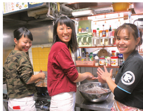
介護施設「いーふみーや」でサーターアングギーづくりを体験

1泊のみの短い時間でしたが、空港での見送りは涙する生徒もあり、思い出深い交流になったことが見て取れました。