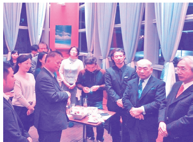
都内で久米島関係者が集う

「久米島紬東京展」に合わせ、大田町長、久米島商工会青年部、東京在住の久米島郷友会や町関係者との集い「久米島ナイト」を、11月28日にメゾンカイザー虎ノ門ヒルズ店で開催しました。赤鶏のロースト