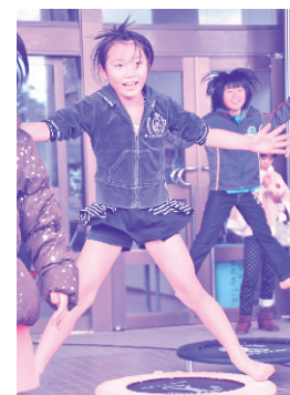
トランポリンコーナー