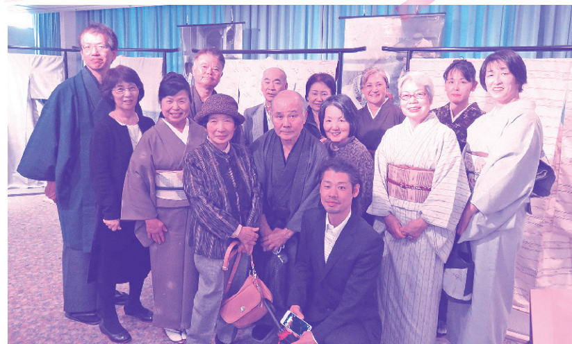
東京久米島郷友会長や会員のみなさま、久米島観光大使と

久米島紬が国の重要無形文化財に指定されて10周年を迎えることを記念し、11月29、30日に東部百貨店池袋店のホールにて、「久米島紬東京展」が開催されました。久米島紬の歴史を伝えるパネルや染色材、着物、帯、反物の展示と見応えのある内容に、多くの人が訪れ盛況となりました。