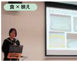
↑たくさんの方の映え写真をお披露目！