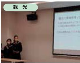
↑インタビューさせて頂いた内容をまとめ、発表しました！