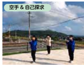
↑空手の形を演武しました！写真は当日最終調整の様子

2023年度、新スタッフ2人を迎え5人体制でスタートしました！スタッフの紹介はまた次回に！