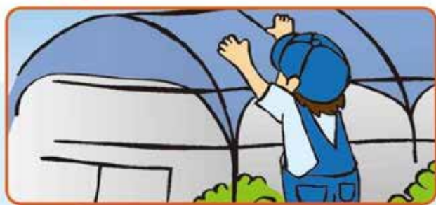
ネット等での固定や早めの撤去でハウスのビニールの飛散を防ぎましょう。