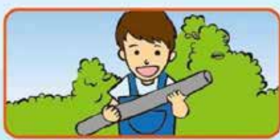
不要なビニール・マルチ等は片付けましょう。