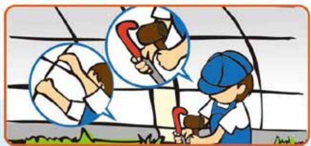
台風時期の前に、ハウスや管理小屋の補修を終えましょう。