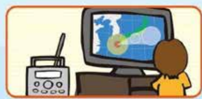
天気予報で台風をこまめに把握しましょう。