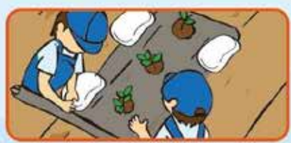
マルチはネットや土のうなどで押さえましょう。