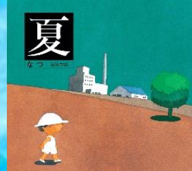
夏 五味太郎 作

こどもの頃、大好きだった暑い夏。擬音語で表現された『夏』。音でワクワクわいわ昔の記憶蘇ってくるような、そんな絵本です。