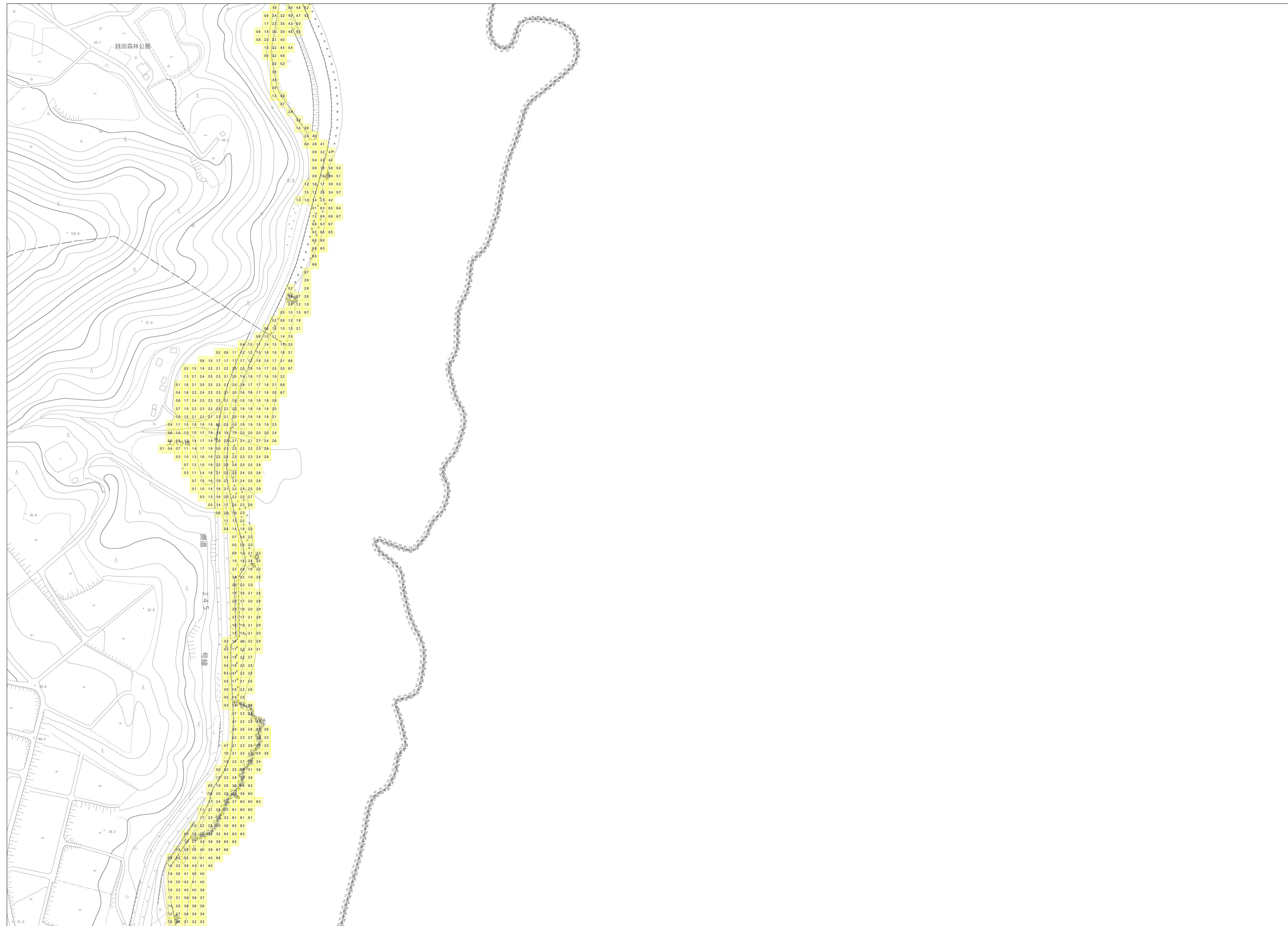
この地図は、沖縄県数値地形図を使用したものである。(平28企情第334号)