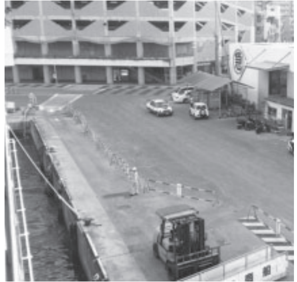
久米島フェリーより撮影

島袋 県の港湾計画は、どこまで進んでいるのか。 町長 泊港フェリーターミナルの那覇埠頭への移動は、25年度以降の計画で実施