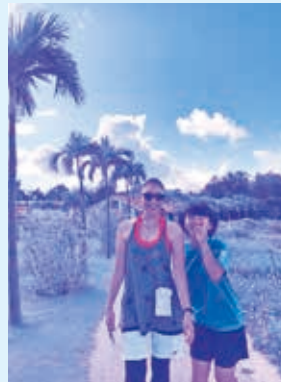
“セレブ激写 in Kumewood”