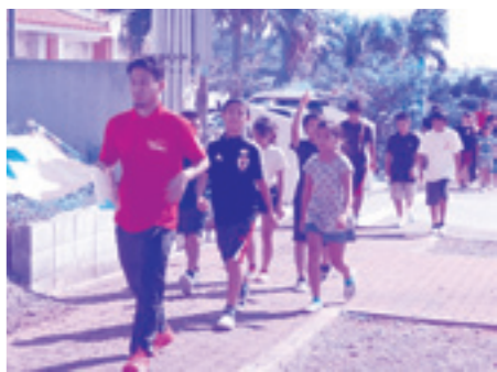
博物館へ避難中(久小)

11月2日(木)久米島町防災訓練が実施されました。この訓練は、大地震・大津波を想定し多くの町民が地震・津波から命を守ることが出来るよう避難訓練の実施、防災資機材の取扱訓練等が行われ多くの町民の皆さんが参加されました。地震や台風等の自然災害はいつ私たちの身に降りかかるかわかりません。いま一度防災について考え直し、一人一人が出来ることを家族で話し合い、日頃から万全な準備をしておきましょう。