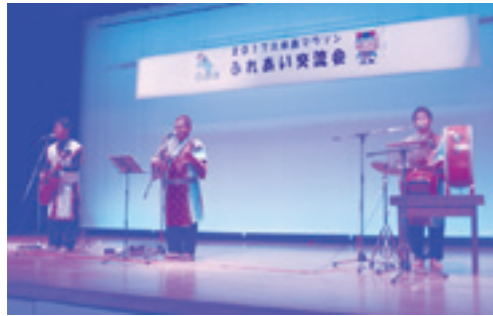
「島ぐる」による民謡ショー

大会中止は、楽しみにしていたランナー、地域の清掃や参加者の受入準備などご協力いただいた町民の皆さまには残念な結果となりました。来年「2018久米島マラソン」は第30回記念大会として、ランナーの皆さまが”FUNRUN” 楽しく走り、思い出に残る大会となるよう準備を進めて参りますので、よろしくお願い致します。