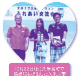
10月22日(日)久米島町で 婚姻届を提出した久米夫妻