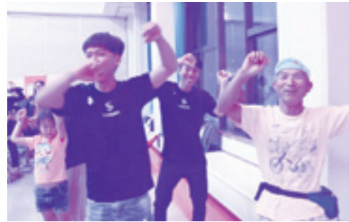
最後はみんなでカチャーシー