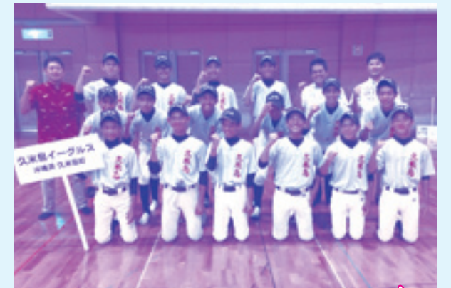
離島甲子園に参加して成長した「久米島イーグルス」