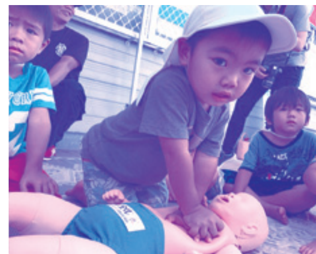
(9月8日救急フェア:応急手当体験を一生懸命頑張ってくれました★)

※火災の早期発見と『逃げ遅れ』を防ぐために住宅用火災警報器を設置しましょう。住宅用火災警報器の交換の目安は10年です。定期的に動作の確認をしましょう。 ○消防法及び市町村条例(平成23年6月施行)により、すべての住宅に火災警報器の設置が義務づけられました。