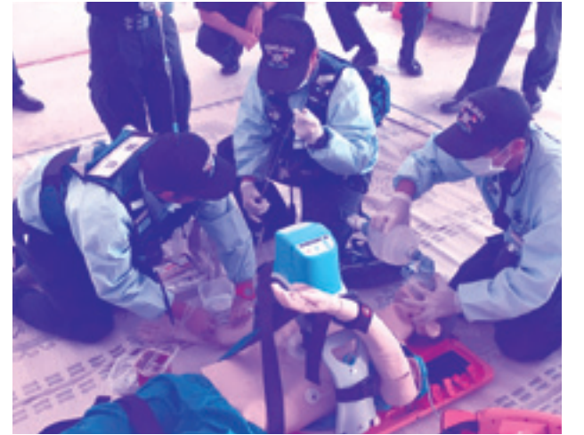
(9月7日救急技能展示訓練:自動心臓マッサージ器及び薬剤投与を行っています。)

期間中、当消防本部においても9月7日(木)救急技能展示訓練(久米島町消防本部車庫内にて)、9月8日(金)救急フェア(JA久米島支店駐車場内)が実施されました。