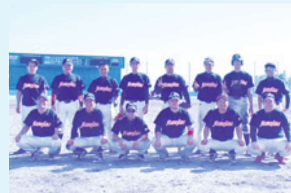
健闘した久米島町代表

決勝に駒を進めたのは与那原町と八重瀬町。7回2対2の同点で、大会特別ルールによる延長の8回、先攻の与那原町が5点を取り、後攻の八重瀬町も4点を返したものの一歩及ばず、7対6で与那原町が優勝しました。