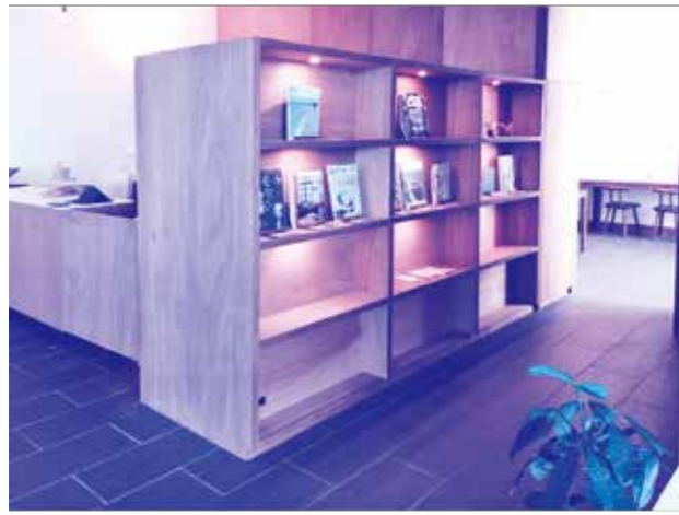
△メディアスペース (店舗中央): 照明付きの飾り棚は、全部で9マスあります。(1マスのおおよその内寸はw900 240h390) 現在は定期購読誌の雑誌棚として活用していますが、雑誌は店内奥に移動し棚は島内の魅力ある情報を発信するプレゼンテーションボックスとして活用いたします。展示は常設ではなくスポットとし展示期間を定めてローテーションして目新しく飽きない空間を目指します。