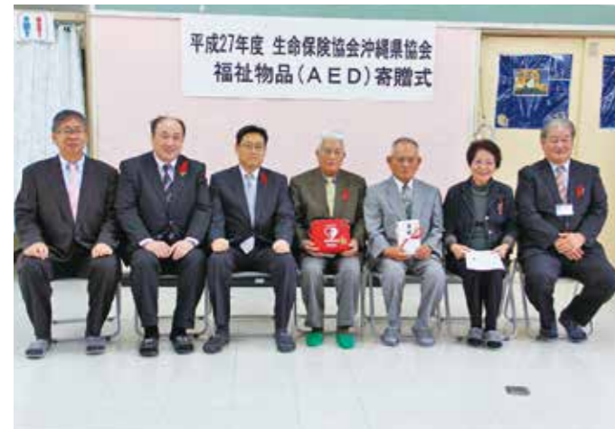
平成27年度 生命保険協会沖縄県協会 福祉物品(AED)寄贈式