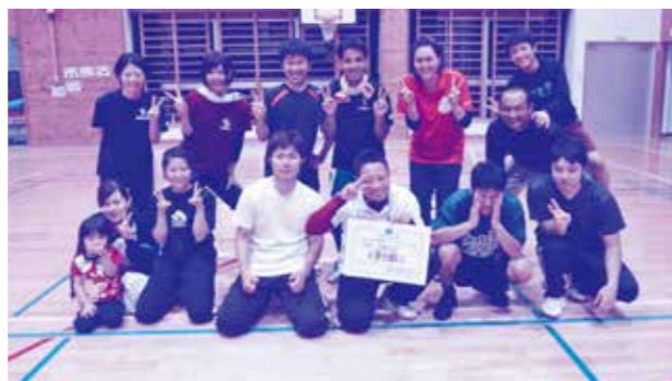
▲準優勝 役場ヤング