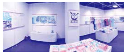
久米島観光・物産と芸術フェアにて「風の帰る森プロジェクト展」

風の帰る森とはどんな森でしょうか。自然が好きな私は島の動植物などの自然はもちろん、空を見上げるような表情を見せる雲や夕陽、夜には星や月を眺めます。