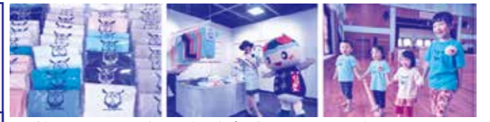
展示会場ではTシャツを販売 風の帰る森プロジェクト展 しいお産の日イベント風景