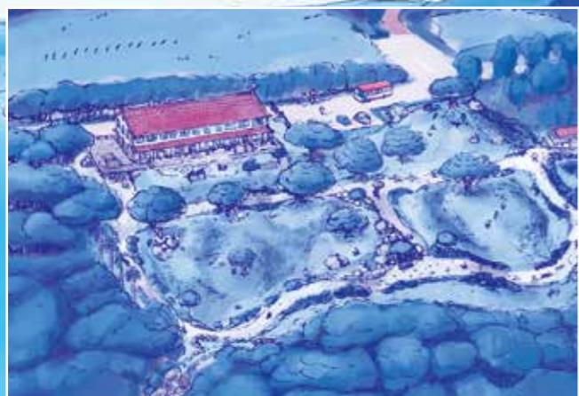
建設イメージ図 田場勝治さん制作(久米クリエーション)

子どもたちの声が海風・山風にのってこだまする「風の帰る森」、福島と久米島の子どもたちが「元気になる森」づくりを町民みんなで応援しましょう！