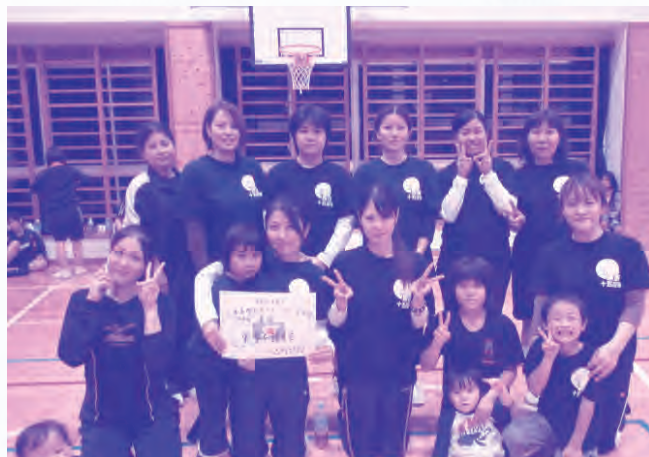
準優勝 兼城チーム