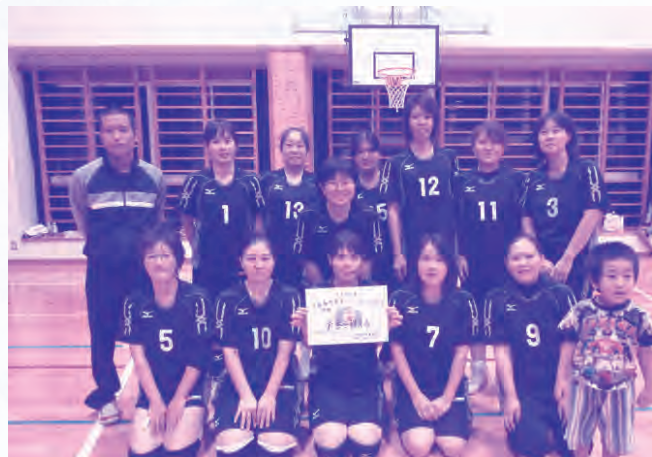
優勝 比屋定チーム