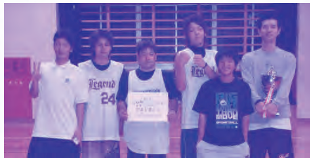
優勝 海老ファイターズ (久米島町漁協)