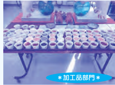
『久米島んちゃ(土)絵の具』 やちむん土炎房