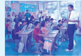
国語部会研究協議

【研究主題】 思いや考えを豊かに表現する授業の創造 ～言語活動の充実を図る授業の展開を通して～