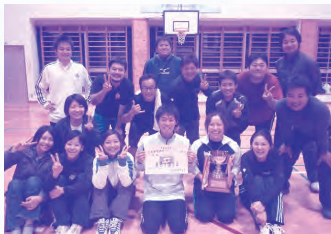
優勝 マンディーズA