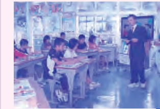
算数部会研究協議

【研究主題】 活用する力をはぐくむ授業の工夫 ～「かく」「伝え合う」活動の実践を通して～