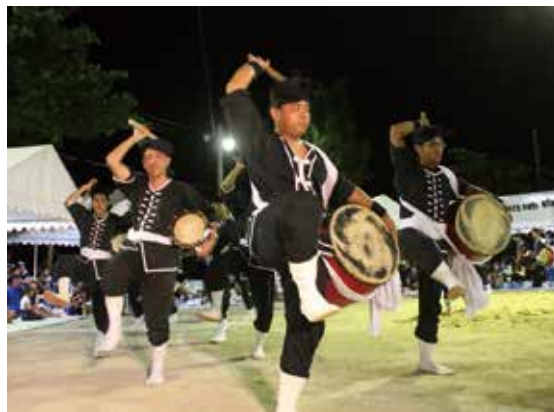
Nishime – Eisâ