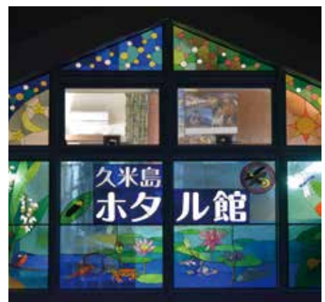
Haut gauche : la rivière derrière le musée est un bon terrain de jeu Bas gauche : on peut étudier une grande variété d'animaux de l'île de Kumejima dans ce musée

Ci-dessus : ce sont des beaux vitraux, comme la lumière de la luciole