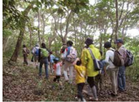
Haut gauche : l'eau de la montagne favorise la richesse de la verdure Bas gauche : la chaîne alimentaire des insectes fabrique la montagne Ci-dessus : exemple d'excursion présentant la présence de vies anciennes dans la zone humide de la Convention de Ramsar

Visite guidée de la zone humide de Kumejima, lieu inscrit sur la liste des sites de la Convention Ramsar