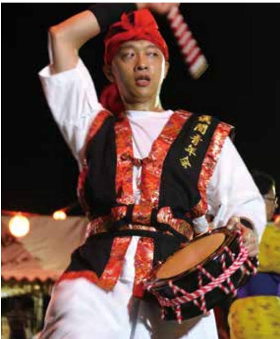
Gima - Eisâ

O-bon (festival bouddhiste japonais honorant l'esprit des ancêtres) d'Okinawa est célébré en Août. Eisâ est une danse, qui se déroule pendant O-bon, pour aider l'esprit des ancêtres à partir dans l'autre monde. Il y a une pratique d'Eisâ différente dans chaque quartier de l'île. Les fans d'Eisâ font le tour de l'île pour regarder les différentes variations d'Eisâ.