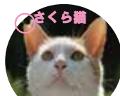
耳カットは手術済

猫は人にエサをもらわなければ生きていけません。【エサを与える事=悪】ではありませんが、適正に管理しなければ増えすぎて人間社会にとっては迷惑な生物となり、また貴重な野生動物に対し危機にもなり得ます。隠れてエサを与えるのではなく、不妊手術を施して、地域猫として生きる権利を与える事も人の役割です。