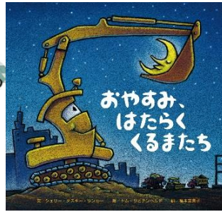
「おやすみ、はたらくくるまち」 作:ジェリー・ダスキーリンカー

じぶたは小さなしょうぼうしゃ。 小さくても元気いっぱい！ 今日も元気に出勤です！