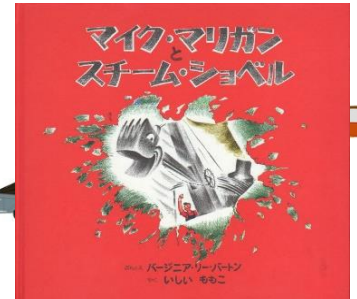
「マイク・マリガンとスチーム・ショベル」 作:バージニア・リー・バートン

ブルドーザー・パワーショベル・クレーン 車！などなど。子どもたちが大好きな くるまち。 一日中はたらいとおつかれさま！ ゆっくりおやすみなさい