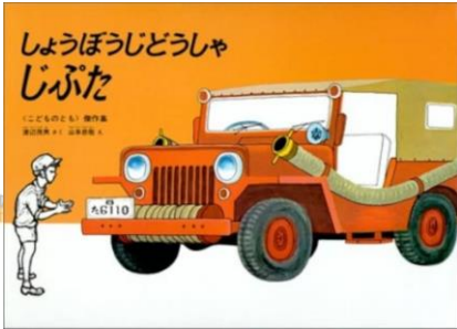
「しょうぼうじどうしゃじぶた」 作:渡辺 茂男

じぶたは小さなしょうぼうしゃ。 小さくても元気いっぱい！ 今日も元気に出勤です！