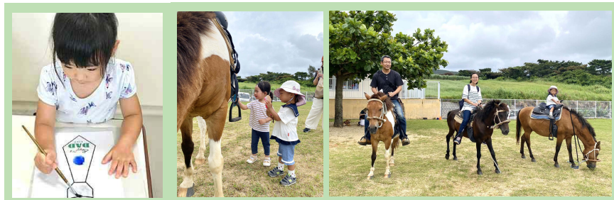
父の日のカードを作ったよ!