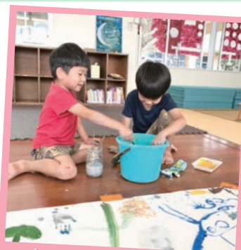
大～きな紙におえかき！