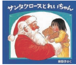
『サンタクロースとれいちゃん』

お母さんのつくるクリスマスケーキに飾るいちごを探しに行き、うさぎの家を見つけたかすみちゃん。なんと、そこでもうさぎのお母さんがケーキをつくっているではありませんか！ほんわかしていて、温かくなる一冊です♪