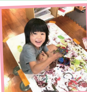
てのひらや足の裏も使って描いたよ！