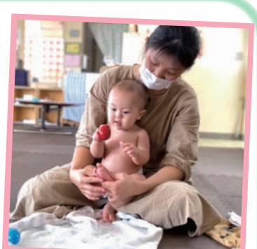
オイルを使ったベビーマッサージ