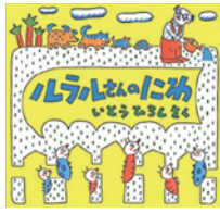
『ルラルさんのにわ』 いとうひろし 作

動物をテーマにした絵本はたくさんありますが意外に人気なのが「ワニ」！怖いけどでもちょっと愛嬌ある？のかな？6月にも「ワニワニ」のシリーズをご紹介しましたね。というわけで 今月も3冊の「ワニ」の絵本をご紹介します。