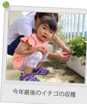
今年最後のイチゴの収穫