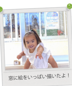
窓に絵をいっぱい描いたよ！