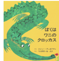
『ぼくはワニのクロッカス』 ロジャー・デュボアザン 作

本を開くと左にワニさん 右にはいしゃさん。一匹とひとりの同じせりふでのやりとりがなんとも楽しい絵本です。歯みがきしなごやー！