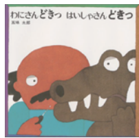
『わにさんどきつ』 はいしゃさんどきつ 五味太郎 作

ルラルさんが大切に手入れしている芝生の庭にある日一本の丸太が！と思ったら実はそれはワニでした！ルラルさんちの庭に転がって芝生がチクチクするのを楽しんでください！