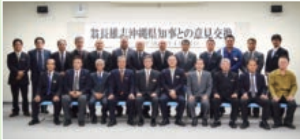
県知事との集合写真