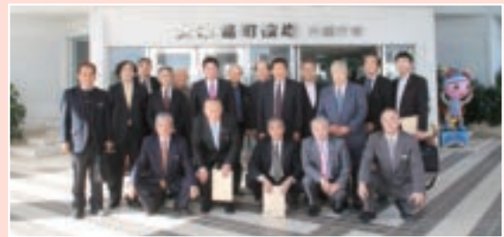
中泊町議会議員と集合写真