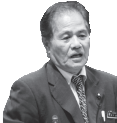
盛本 實 議員