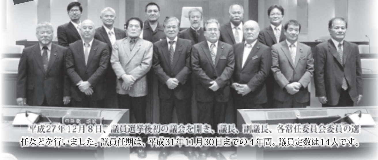
平成27年12月8日、議員選挙後初の議会を開き、議長、副議長、各常任委員会委員の選任などを行いました。議員任期は、平成31年11月30日までの4年間。議員定数は14人です。